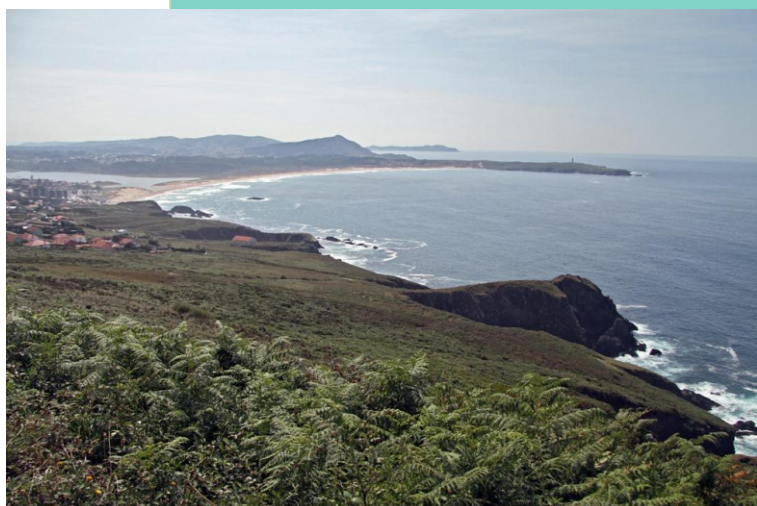
Punta Felpiura desde o miradoiro do Paraño