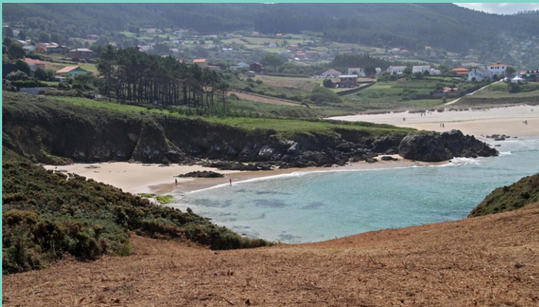
Praia de Porto Carrizo