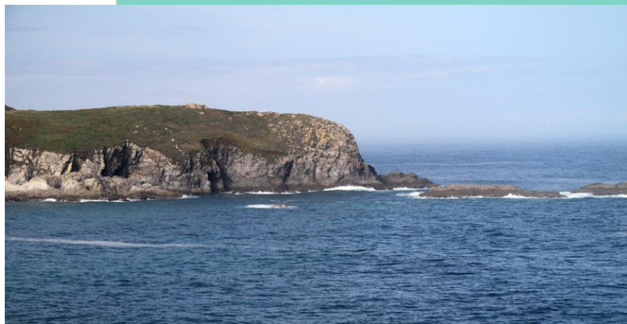
Illotes de Marnela e Punta Corveira