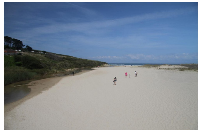
Desembocadura do Ríomaior na praia de Pantín