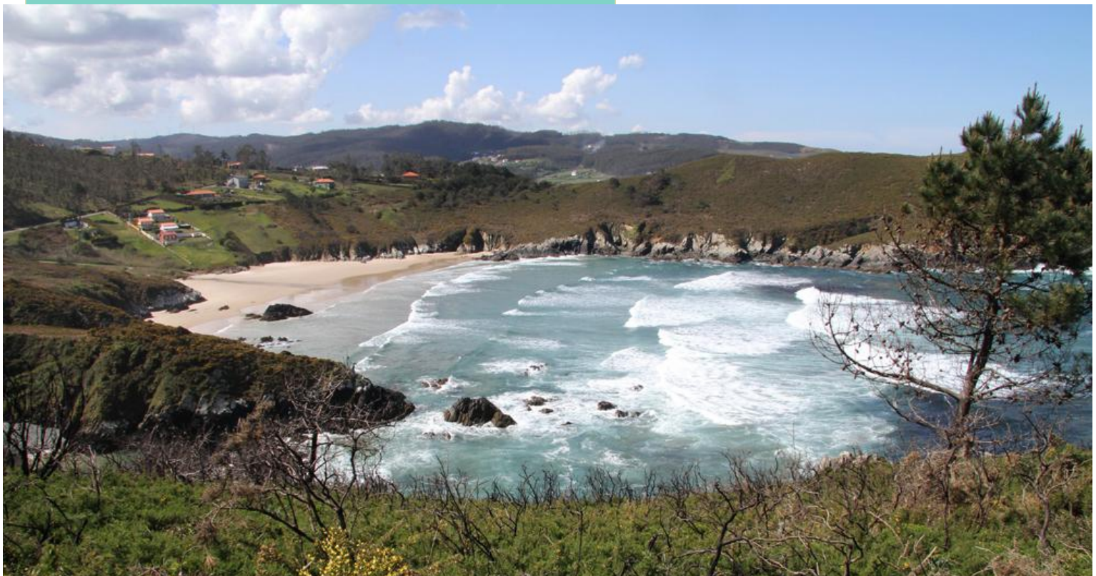
Praia de Baleo