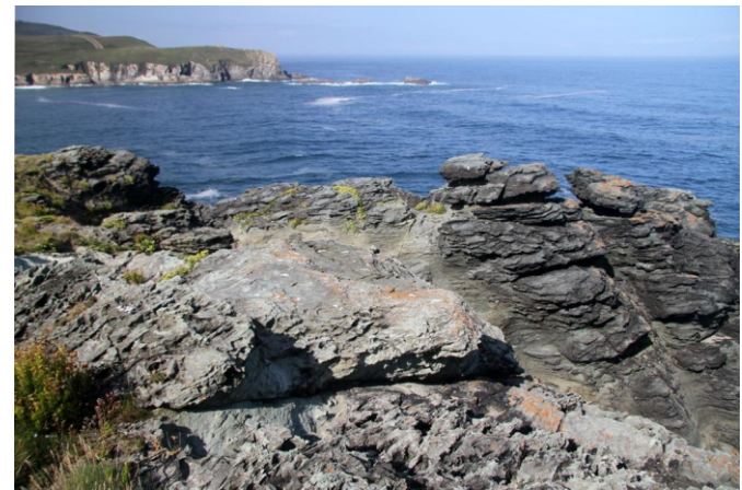
Punta da Gabeira