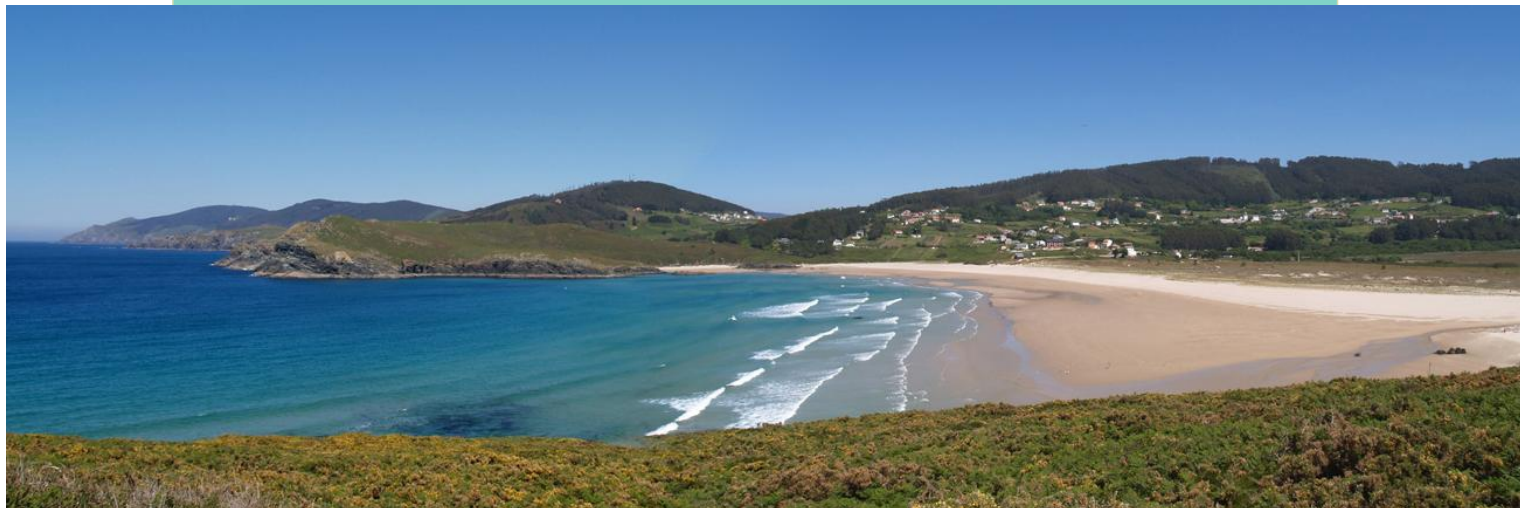
Praia do Rodo (Pantín). Detrás das duna atópase unha lagoa litoral moi colmatada polos sedimentos