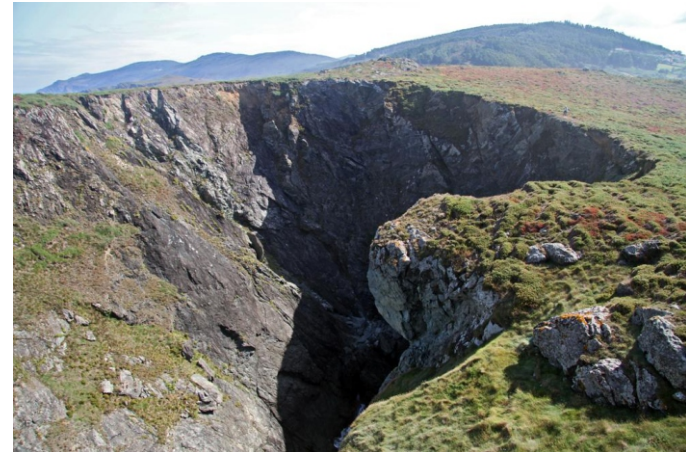
Punta Torrella: O Furado Vello. Nesta zona pódense ver rochas moi antigas (anfíbolitas) e lousas verdes separadas por unha falla.