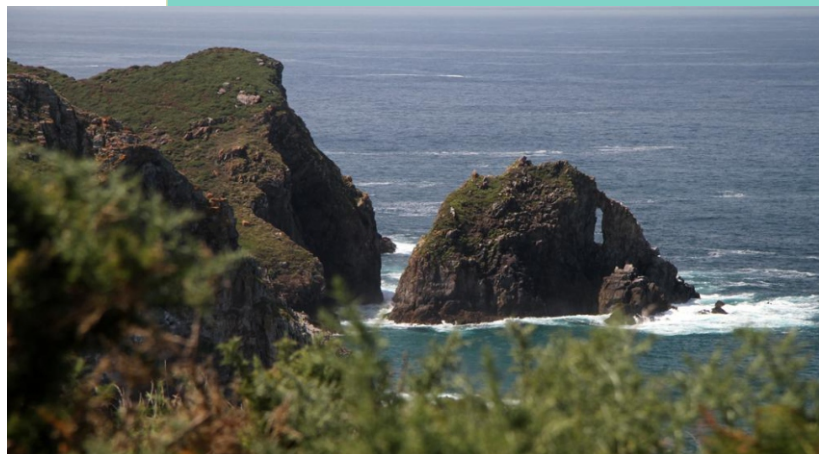
Punta dos Prados