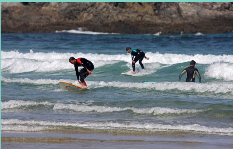
Surfistas en Pantín, na celebración do Campeonato do Mundo de 2018.